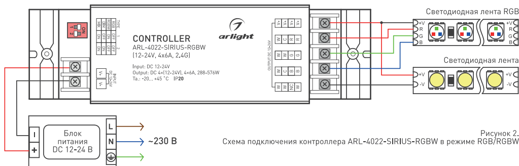
Рисунок 2. Схема подключения контроллера ARL-4022-SIRIUS-RGBW в режиме RGB/RGBW