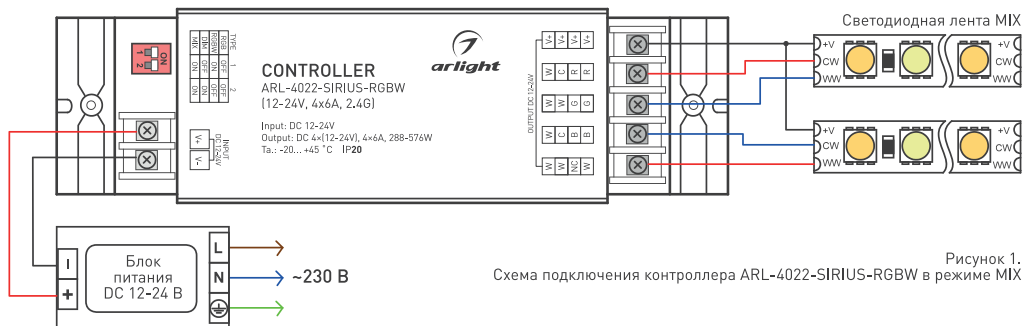
Рисунок 1. Схема подключения контроллера ARL-4022-SIRIUS-RGBW в режиме MIX