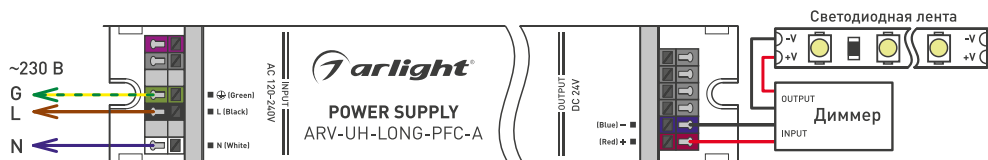
Рис. 2. Схема подключения блока питания к светодиодной ленте через диммер