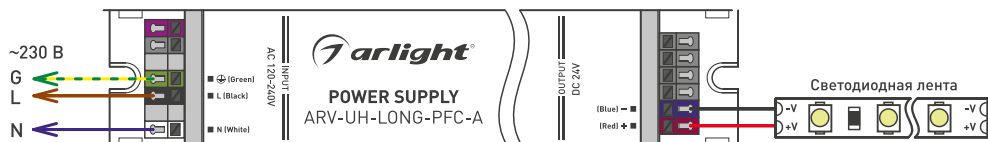
Рис.1. Схема подключения блока питания напрямую к светодиодной ленте